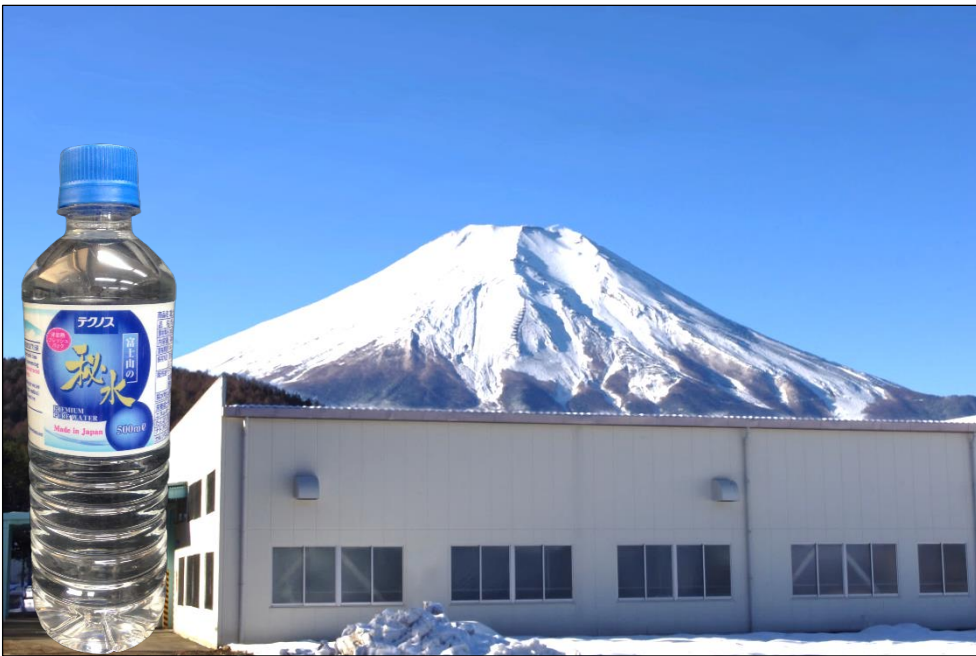
山梨県の「秘水」製造工場