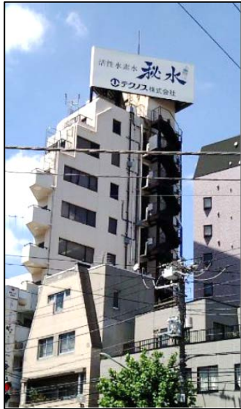
テクノス社 本社ビル