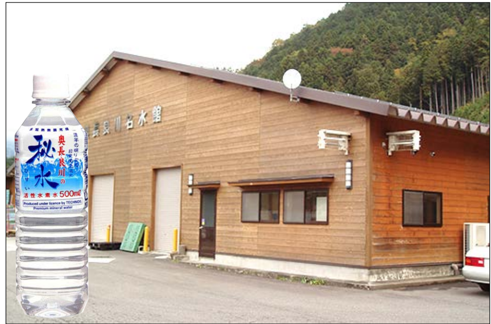
岐阜県の「秘水」製造工場